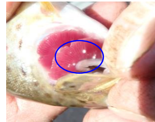
Vues des glochidies sur les branchies de truite

Temp. H 2 O = non mesurée Cond. = non mesurée