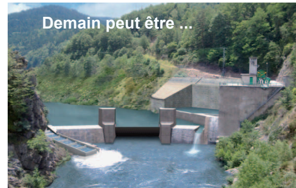
Demain peut être ...